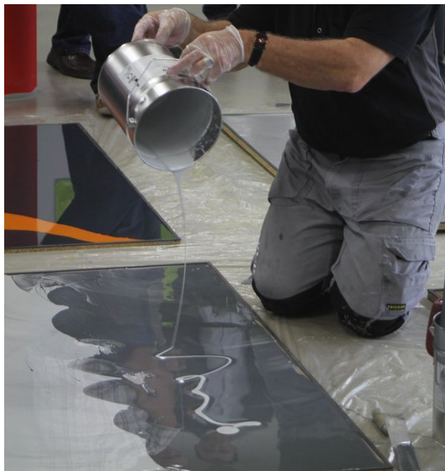
Obr.: Ukážka z aplikácie „Arturoflame“ miešaním dvoch odtieňov Arturo PU 2060 .

Aplikácia tejto bezšvovej podlahy je rovnako ako pri epoxidovej podlahe možná na cementové, anhydritové, magnezitové podklady, dlažbu či asfalt, jej hrúbka by mala byť cca 2mm.