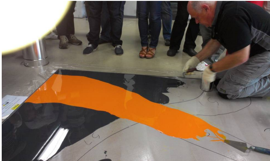
Obr1. Príklad aplikácie designovej liatej podlahy

Polyuretán ako materiál, má v porovnaní s epoxidom rozdielne vlastnosti. Najciteľnejšou je pružnosť, ktorou epoxid nedisponuje a taktiež je to rozdielna chemická odolnosť (napr. pre použitie v potravinárskom priemysle).